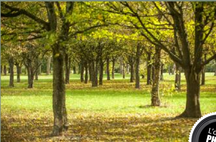
Impression d'automne au Grand parc.